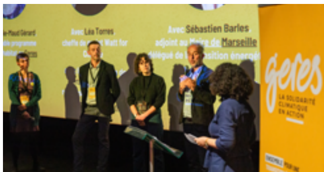
Rencontre autour de la précarité énergétique dans les zones d'intervention du Geres, à Marseille