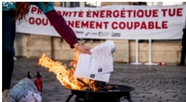
Précaires énergétiques et activistes ont brûlé leurs factures d'énergie devant le Ministère de l'Économie et des Finances

BRAVO ! MERCI À TOUS CEUX QUI SE SONT ENGAGÉS DANS CETTE CAMPAGNE.