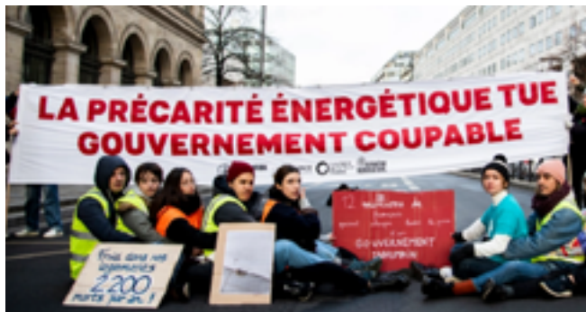
Action d'Alternatiba, les Amis de la terre et Dernière Rénovation devant le Ministère de l'Economie et des Finances.

Des actions d'interpellation ont été organisées par plusieurs organisation du mouvement climat le 24 novembre, pour alerter l'opinion publique et nos décideurs sur l'urgence de la lutte contre la précarité énergétique.