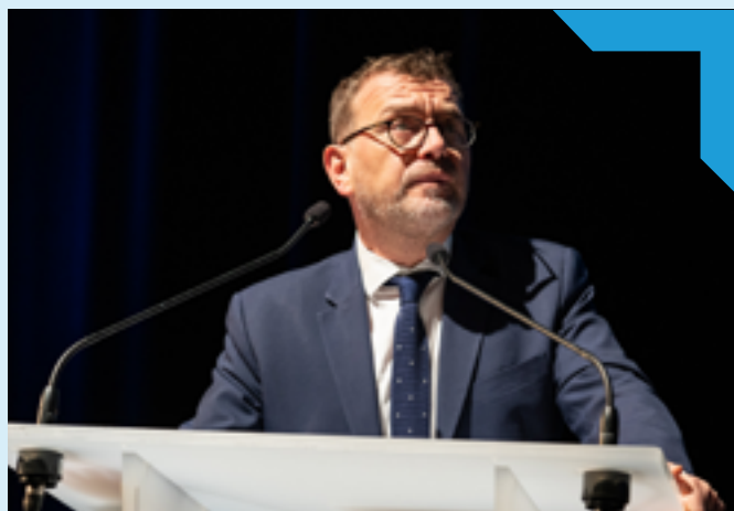
Discours d'Olivier Klein, Ministre de la Ville et du Logement au colloque de la JCPE

Cette année a été marquée par l'organisation d'un colloque nationale, à Paris. Evènement phare de la Journée contre la précarité énergétique, il a accueilli des experts, acteurs de terrain et personnalités politiques majeures pour des débats de haut niveau, animés par des responsables associatifs sur les prix de l'énergie, les obligations de rénovation, et l'accompagnement des ménages précaires dans la rénovation globale de leurs logements. Cet évènement a mobilisé plus de 300 personnes en présentiel.