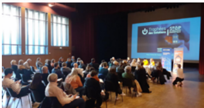
Trophées des solutions de Stop Exclusion Énergétique au Ministère de la Transition Ecologique

Cette journée nationale de mobilisation s'est traduite par l'organisation de plus de 150 événements locaux en France métropolitaine et dans les territoires d'Outre-Mer. Des débats, des réunions d'informations, des ateliers, des visites de chantiers de rénovation, des balades thermiques, des formations d'élus et de travailleurs sociaux, mais aussi des concours photo, pièces de théâtre et escape game ont été organisés par près de 130 associations, collectivités, entreprises et syndicats engagés.