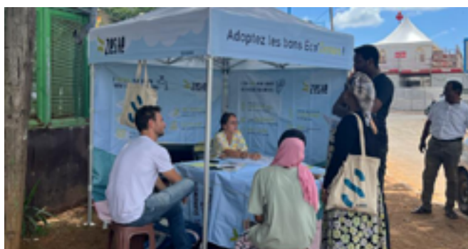
Stand de sensibilisation et d'information aux écogestes, par Soliha à Mayotte